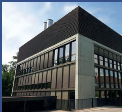
Adolphe Merkle Institut