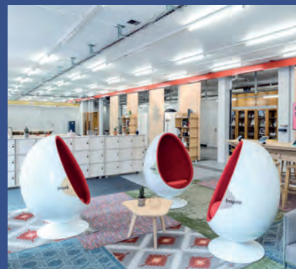
Hochschule für Wirtschaft & Innovation Lab Freiburg