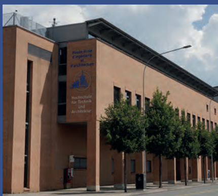
Hochschule für Technik und Architektur